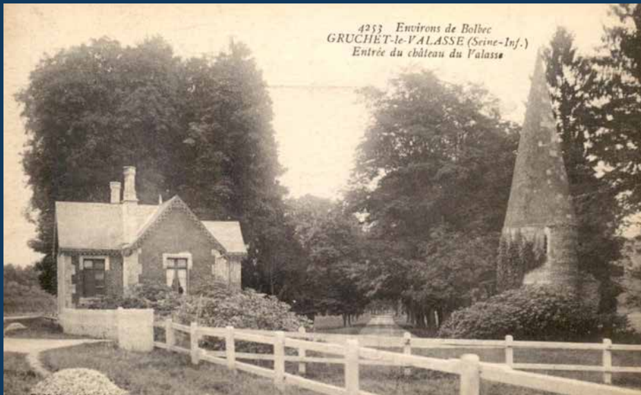
Sur les anciennes cartes postales, cette entrée apparaissait comme très arborée.

Plan du domaine de l'abbaye levé par l'arpenteur royal Jean Legendre en 1691 où 3 tourelles sont représentées.